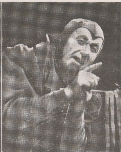
Rigoletto — R. Kasl