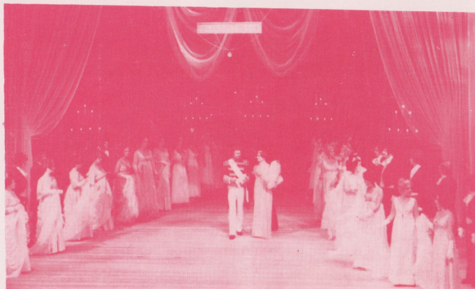
P. I. Čajkovskij: EUGEN ONĚGIN — opera v Divadle Zd. Nejedlého