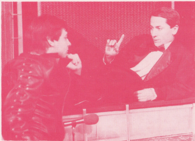
A. Stern: VÝROBCE BOMB aneb ÚTĚK SRDCE — činohra Petra Bezruče