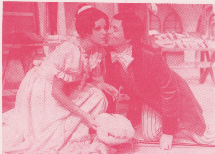
R. Piskáček: PERLY PANNY SERAFINKY — operetní soubor na scéně P. Bezruče a v Divadle Zd. Nejedlého