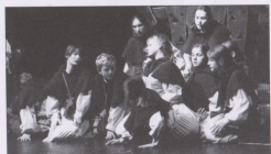
Cenová deska operního studia NDM v operce Pavla Helebranda.