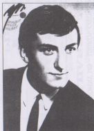
„Každý drabí, jenž by se odvážil tvrdit, že jsem v mládí nebyl hezkým člověkem, bude zastelen.“ říká Bolek Polívka s úsměvem.