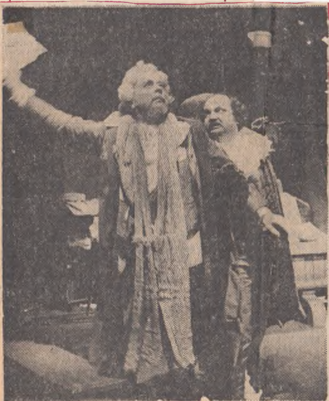
△ Z Janíkovy nejnovější inscenace Rozbitý džbán